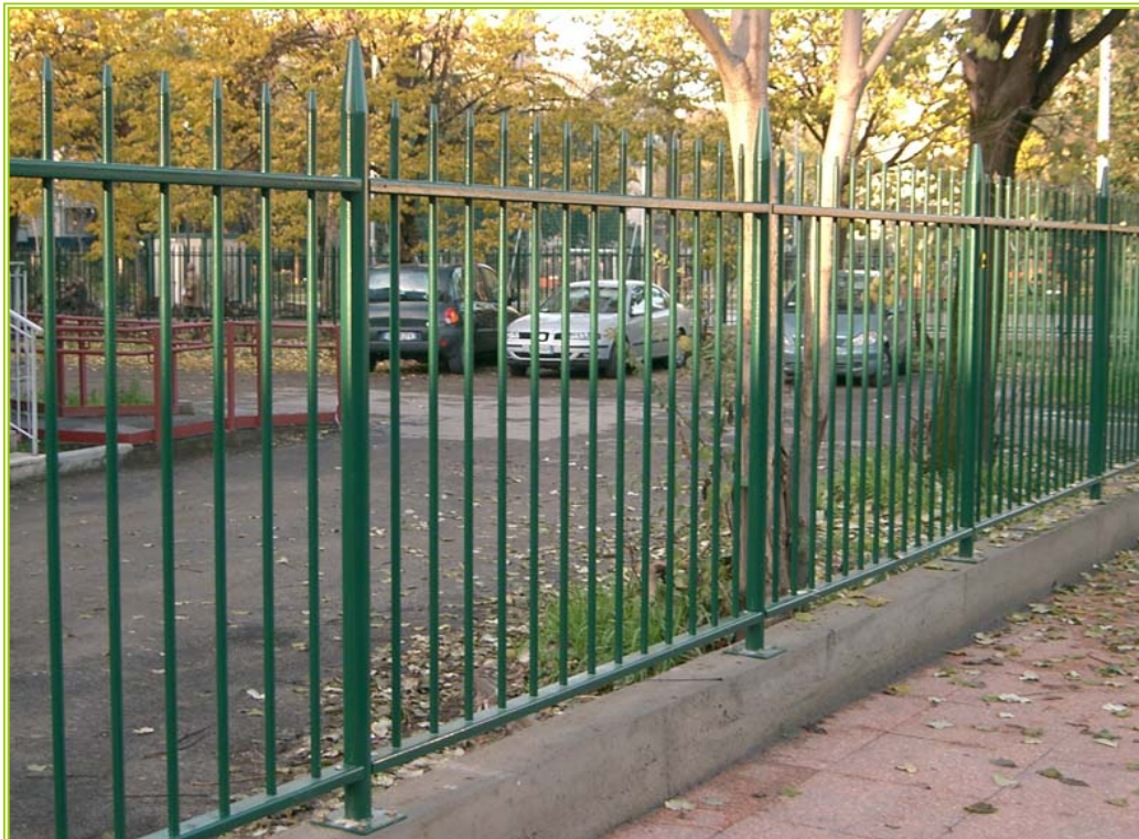
Cancellata in tubi a pannelli modulari

Materiale: Acciaio S 235 JR (UNI EN 10025:1995)