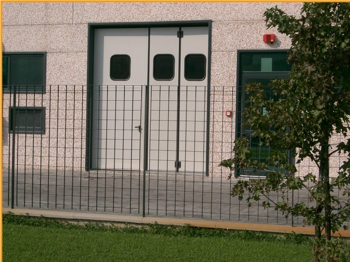
Recinzione modulare in grigliato elettrosaldato a maglia quadrata

Materiale: Acciaio S 235 JR (UNI EN 10025:1995)