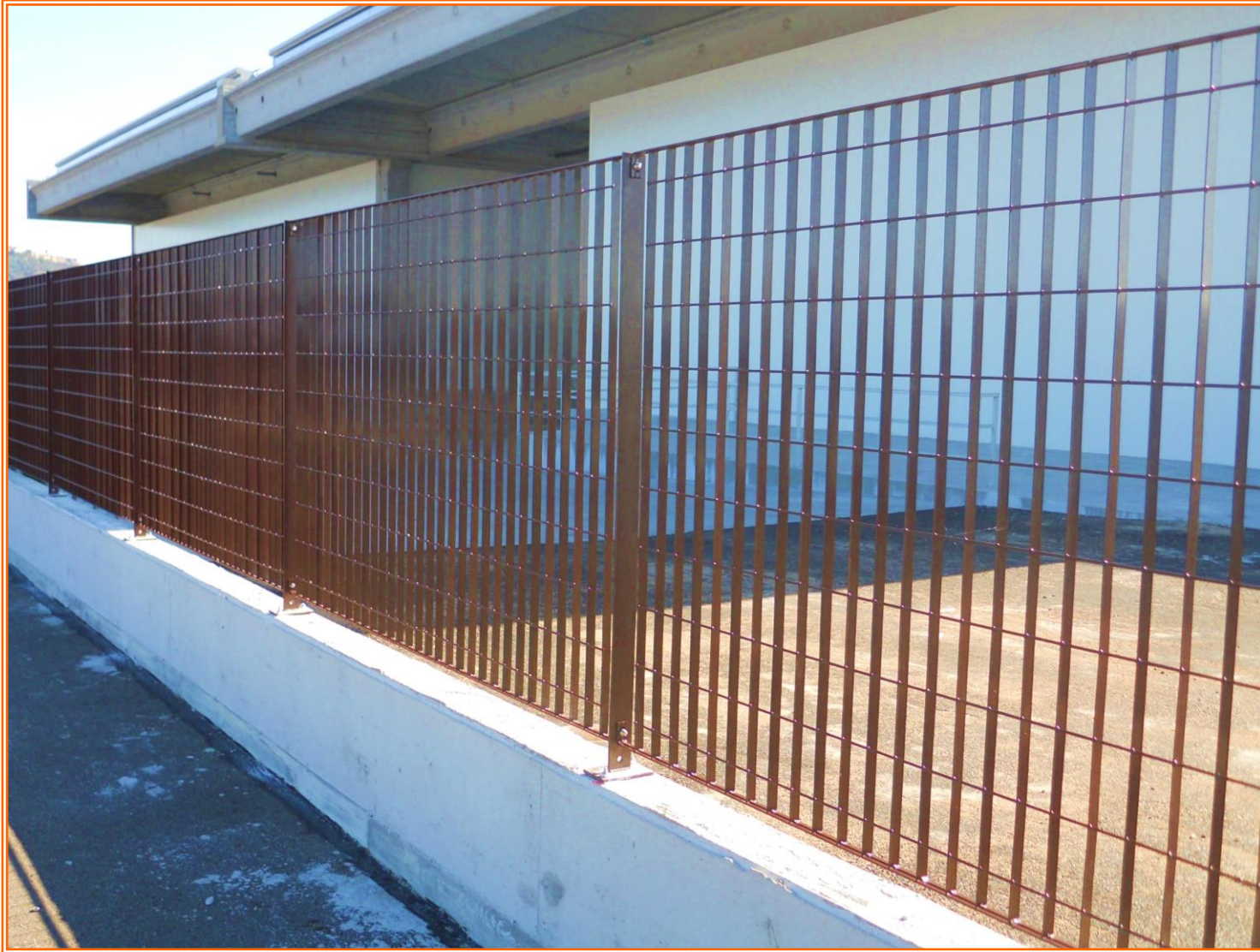
Recinzione modulare in grigliato elettrosaldato a maglia rettangolare